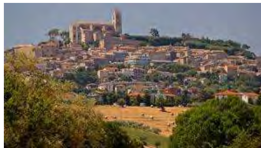
(Fermo): FermoInAcquarello (Central Venue)