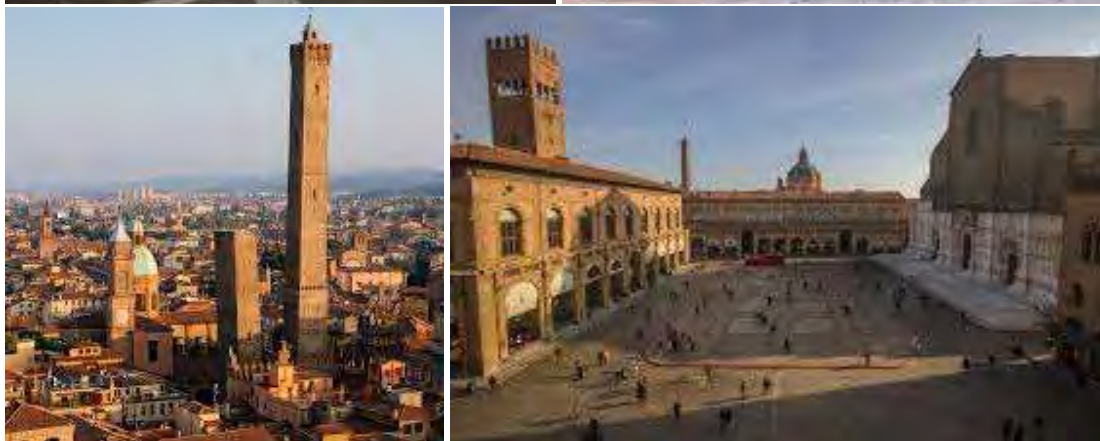
Bologna - photos are from 2025 edition